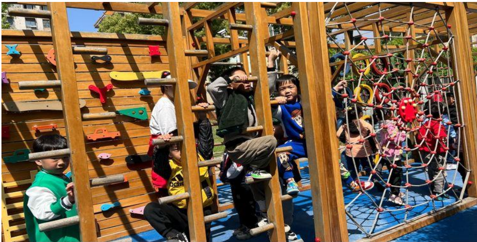
上午户外活动的过程中，老师们认真观摩学习，拿起手机记录下精彩的活动瞬间。